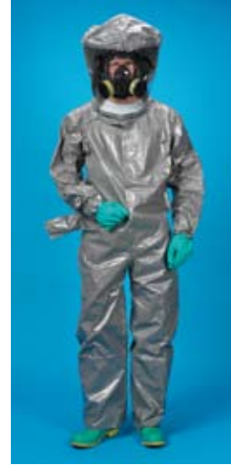
Estilo C3T400 Traje encapsulado, acceso por la espalda, espalda plana, cremallera de 48" solapas sobre cremallera, careta de protección de PVC de 20 mil, puños elasticados, 1 puerto de escape con guardera, tubo de entrada de aire, botas de protección incorporadas con solapa para botas.