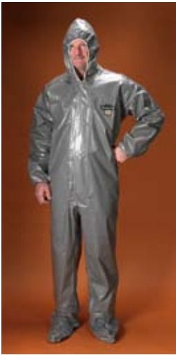
Estilo C3T150 Overall, capucha, elástico alrededor de la cara y los puños, botas incorporadas al traje.