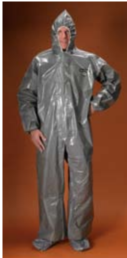
Estilo C3T160 Overall, capucha, elásticos en los puños, botas de protección con solapa.