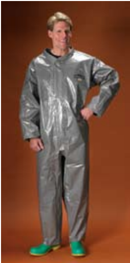
Estilo C3T100 Overall, cuello, muñecas y tobillos abiertos.