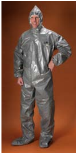
Estilo C3T151 Overall, capucha equipada con respirador, elástico alrededor de la cara y los puños, botas incorporadas al traje.