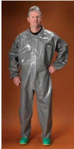
Estilo C3T110 Overall, cuello, elástico en puños y tobillos