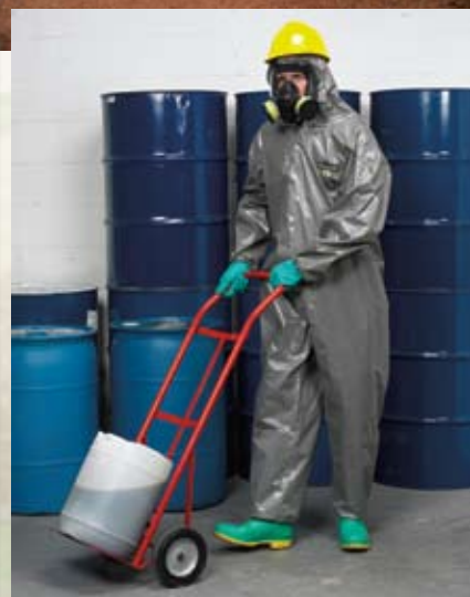
ChemMax™ 3 ofrece protección contra muchos productos químicos tóxicos de uso industrial.