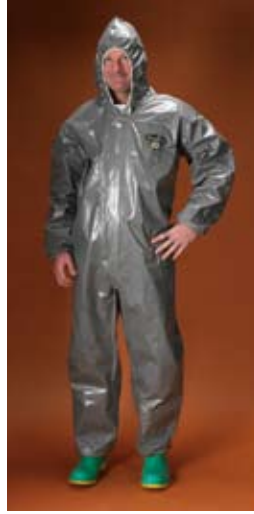
Estilo C3T130 Overall, capucha, elástico alrededor de la cara, puños y tobillos