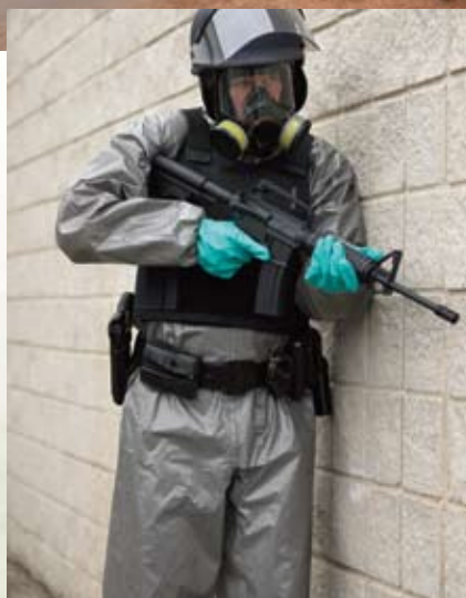
El material ChemMax™ 3 tiene sus orígenes en los tejidos de protección diseñados para la OTAN y están respaldados por los datos obtenidos en las pruebas de guerra química (sin subrogar)

Confíe en los trajes ChemMAX™ 3 y sentirá la tranquilidad de saber que está protegido de los peligros que existen alrededor de este traje.