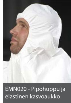
EMN020 - Pipohuppu ja elastinen kasvoaukko