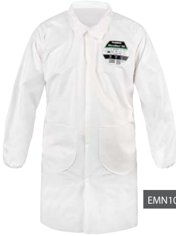
EMN101 - Laboratoriotakki

MicroMax® NS -lisävarustevalikoima joustavaan ja mukavaan suojaukseen erilaisia käyttöjä varten