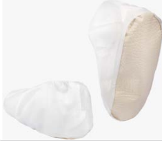
EMN022NS - Kenkäsuojat, liukumaton pohja