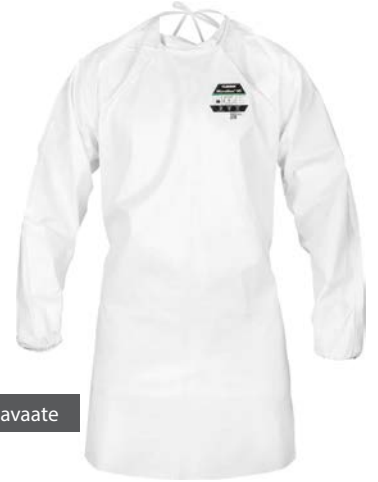
EMN527 - Sairaalasuojavaate