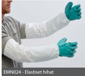
EMN024 - Elastiset hihat