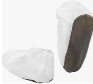
EMN022ANS - Kenkäsuojat, liukumaton ja antistaattinen pohja