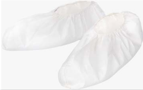
EMN022 - Kenkäsuojat, ei pohjaa

MicroMax® NS -kenkäsuojien valikoima suojaa käyttäjää ja ympäristöä.