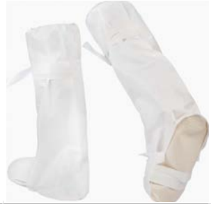
EMN023NS - Kenkäsuojat, liukumaton pohja