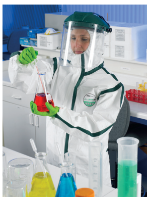
Color de costura solo con fines ilustrativos. Las costuras estándar son blancas.