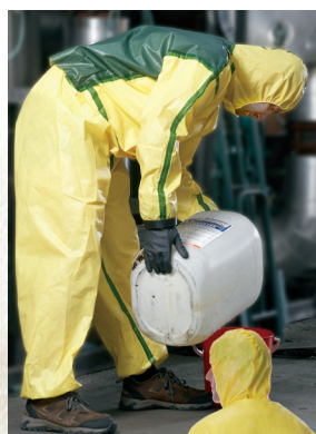
Una solapa ChemMax® sellada en la parte superior y en los lados permite la circulación de aire hacia dentro y hacia fuera de la prenda.